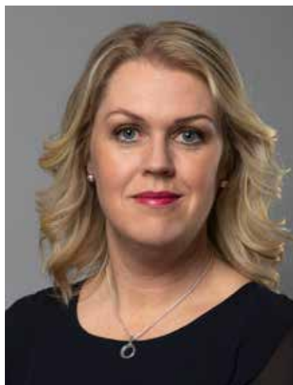
Lena Hallengren, socialminister

Området omfattar såväl hälso- och sjukvård som läkemedel och tandvård. Målet för hälso- och sjukvårdspolicen är att befolkningen ska erbjudas en behovsanpassad och effektiv hälso- och sjukvård av god kvalitet. Vården ska vara jämlik, jämställd och tillgänglig.