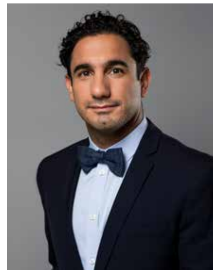
Ardalan Shekarabi, socialförsäkringsminister

Andra mål är att administration och förvaltning av ålderspensionssystemet ska bedrivas med låga kostnader och till nytta för pensionärer och pensionsparare. Informationsgivningen ska ge pensionsspararna goda möjligheter att bedöma sin framtida pension och vad som påverkar den. Kunskapen om livsinkomstens betydelse för den framtida pensionen ska öka för kvinnor och män.